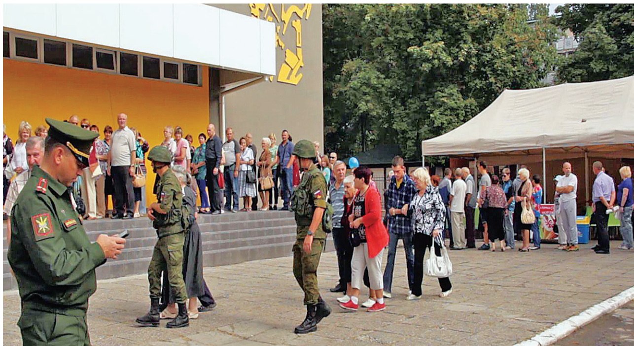
22 de secții de votare pentru alegeri în Duma de Stat au fost deschise în toate orașele din regiunea transnistreană

SUPLIMENT DE COMBATERE A INFORMAȚIEI FALSE ȘI TENDENȚIOASE DIN MASS-MEDIA