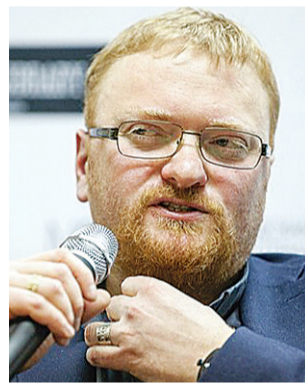
Vitaly Milonov este un alt propagandist ajuns în fotoliu de conducere

„propaganda homosexuală printre minori”, Milonov a mixat conservatismul religios cu activitățile tabloid-prietenoașe, incluzând atacuri asupra cluburilor gay, la un festival