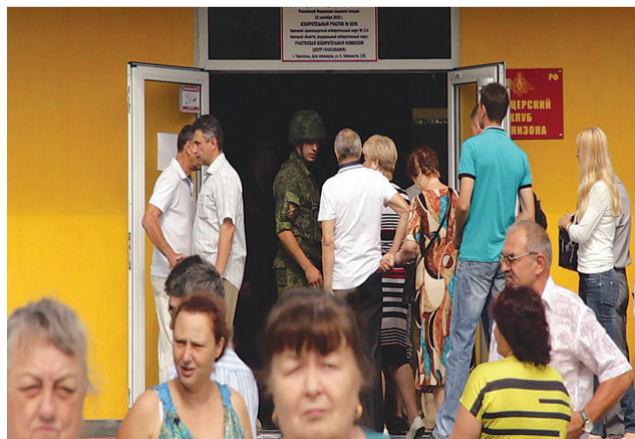
ZIARUL DE GARDĂ