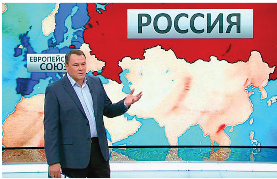
Piotr Tolstoy, prezentator la canalul public de televiziune rus a ajuns în Parlament

Piotr Tolstoy este prezentatorul talk-show-ului Vremya Pokazhet („Timpul va arăta”) la canalul public de televiziune Pervy Kanal. Emisiunea acestuia figurează destul de frecvent în rapoartele Disinformation Review, unde East StratCom Task Force documentează dezinformarea făcută în favoarea Kremlinului. Show-ul lui Tolstoy arată experți selectați riguros și politicieni ruși populști care concurează în arta teoriei conspirației și a minciunilor. Specialitatea sa este să invite un disident la emisiune (dar întotdeauna doar unul, și cel mai des, un străin): cineva care este în dezacord cu ma-